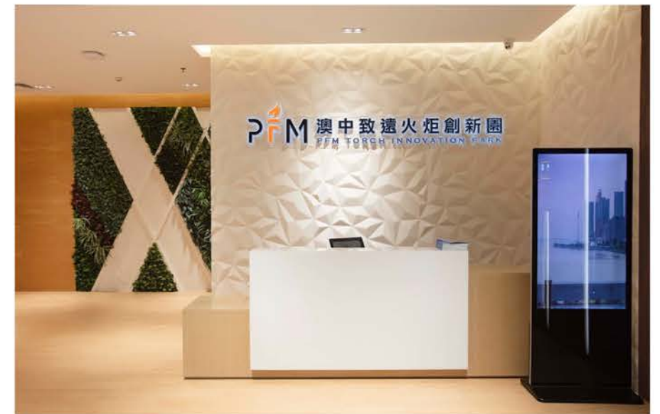
澳中致遠火炬創新園。