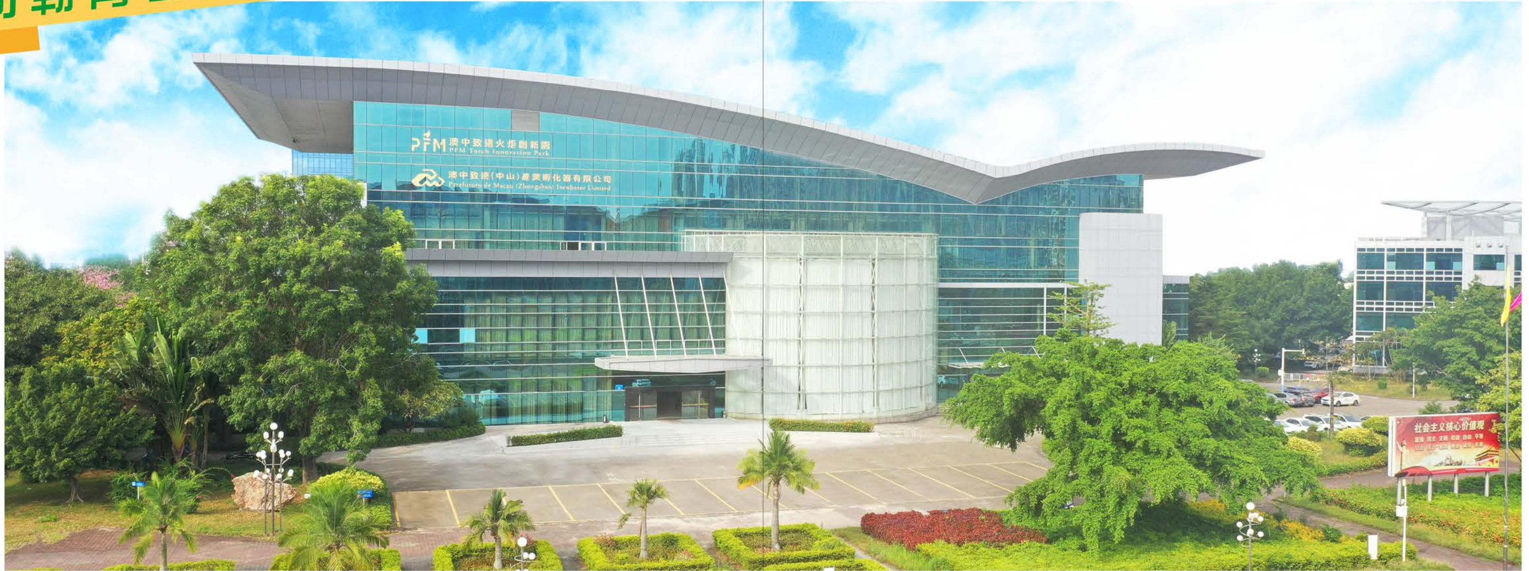
澳中致遠火炬創新園外觀。