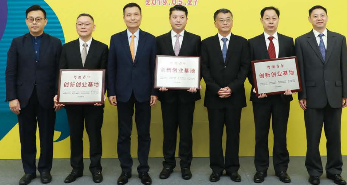
澳中致遠火炬創新園入選首批“粵澳青年創新創業基地”。