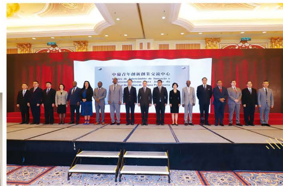
“中葡青年創新創業交流中心”落戶創孵中心。