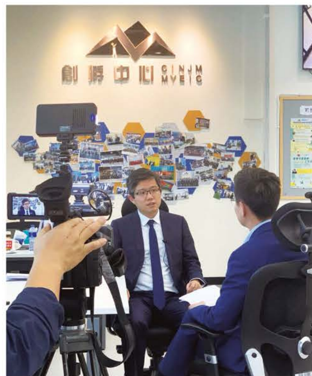
雷震接受內地中央電視台訪問。