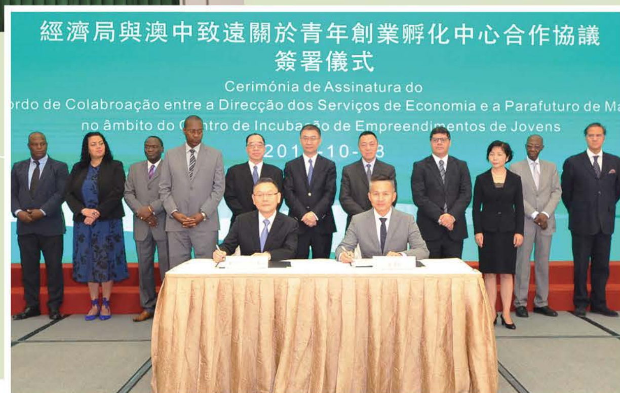
澳中致遠與經濟局簽協議，成為創孵中心的營運方。