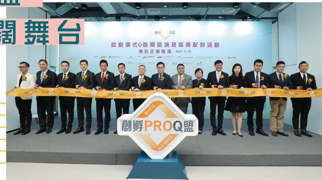
“創孵 ProQ 盟”首場活動獲本澳六大博企支持。