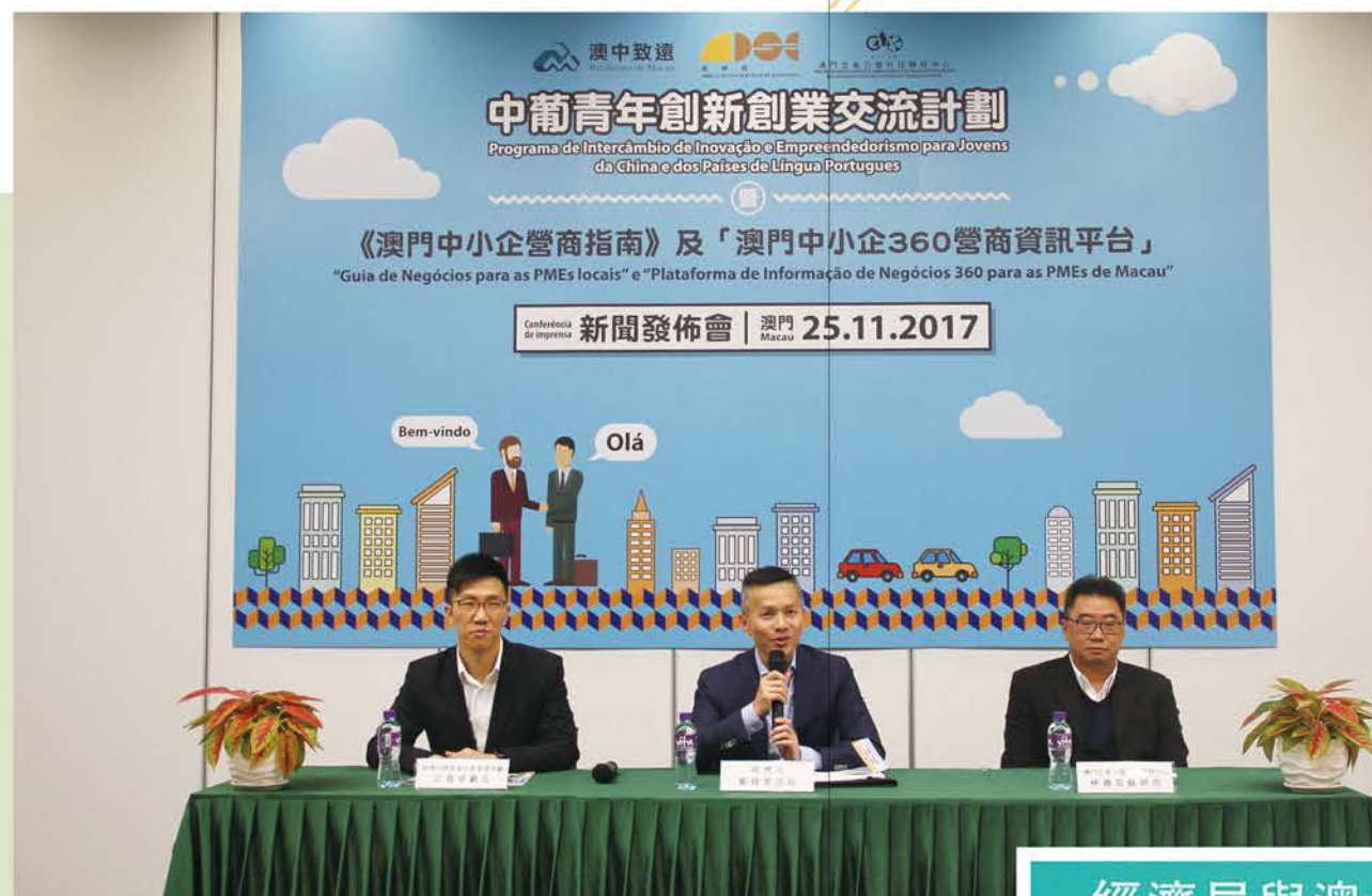
經濟局在創孵中心舉辦“中葡青年創新創業交流計劃”新聞發佈會。

“創孵中心的電話尾號是7-24-365”。意思是說，一天24小時、全年365天，你都可以來。”澳中致遠行政總裁、創孵中心董事長崔世平在接受《人民日報》訪問時介紹，這是為適應年輕一代彈性工作的需求，“他們可能白天上班，利用周末或下班時過來。”（《櫛風沐雨“蓮花”盛開——澳門回歸祖國二十周年經濟發展綜述》，2019年12月6日刊登）