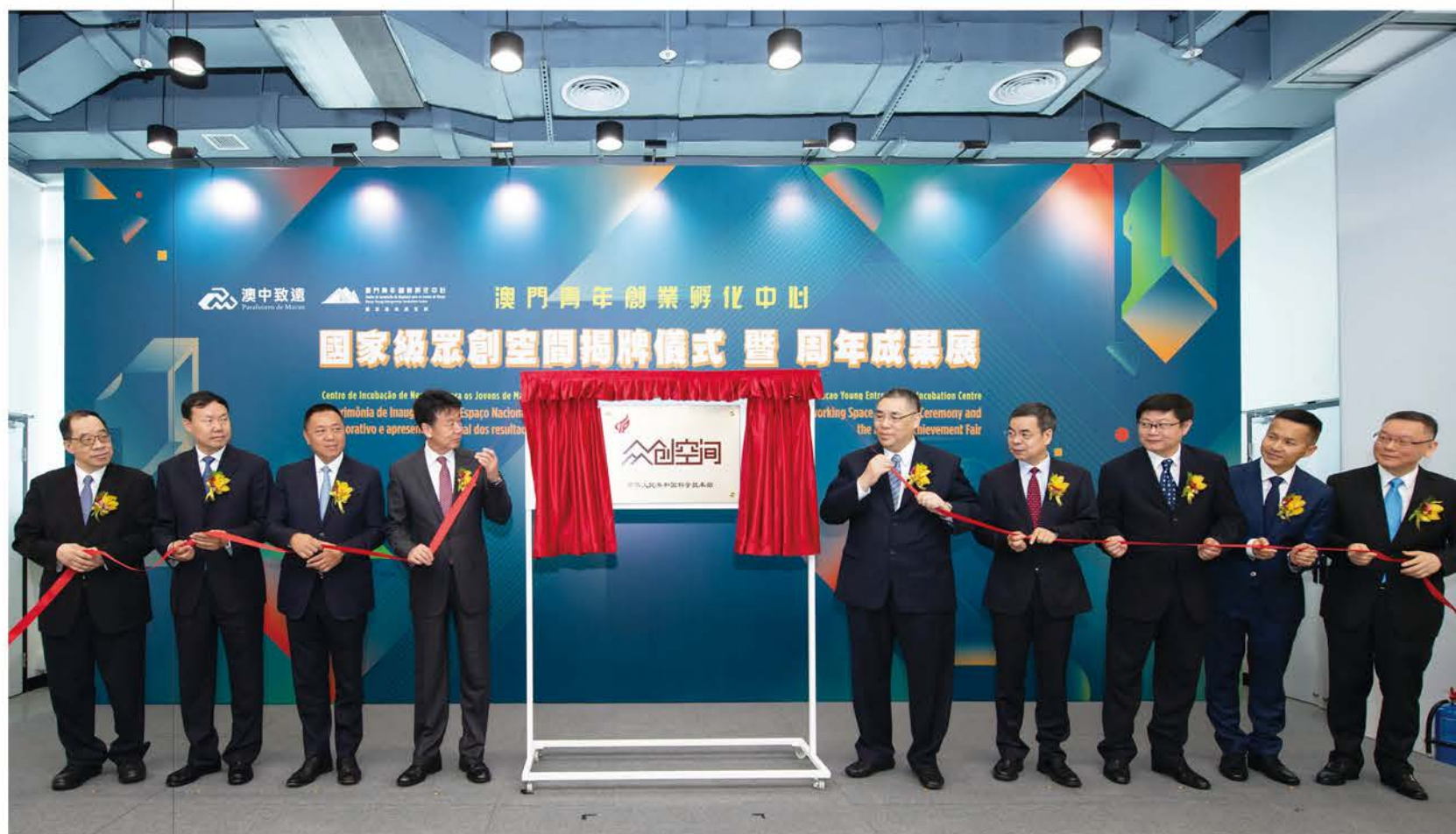
“國家備案眾創空間”揭牌儀式。