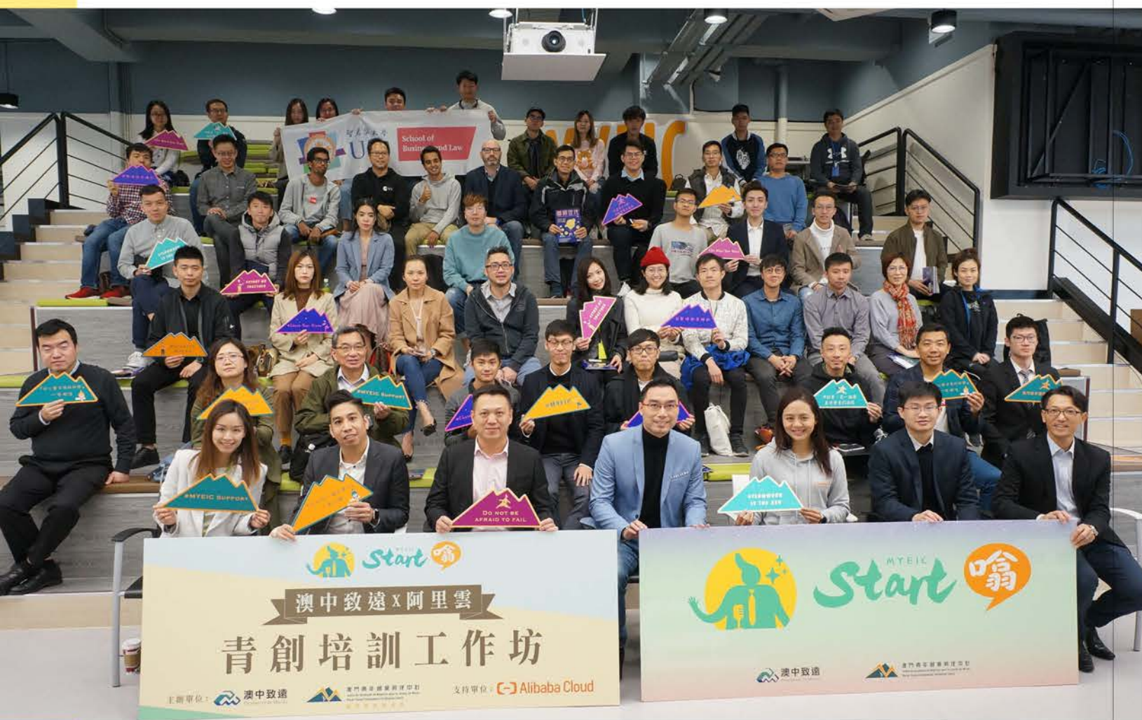
“阿里雲青創培訓學院”開辦培訓工作坊。