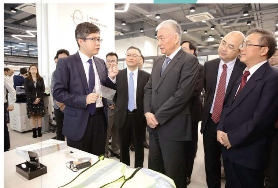
雷震向參觀創孵中心的國家科技部部長王志剛介紹項目。