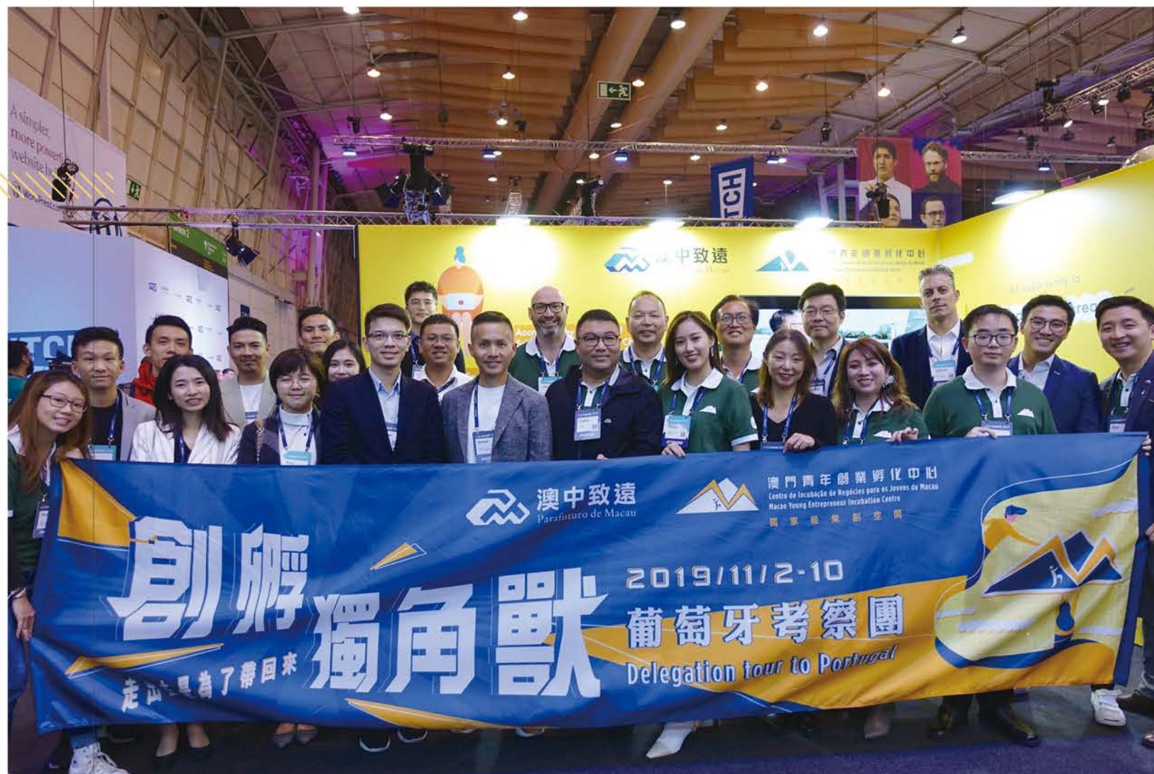
組織會員赴葡參加 WebSummit。