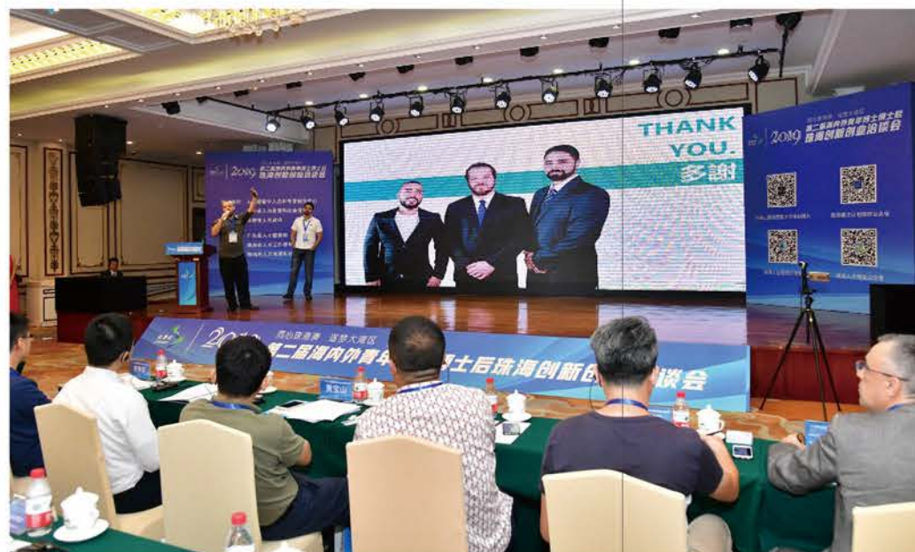
組織會員參與內地大型路演對接活動。

考慮到初創企業往往資源不足，接觸大企常常遇到較高門檻，創孵中心2019年推出“創孵ProQ盟”路演及商業配對活動，為初創連線大企業、大買家。四期活動反響熱烈，促成高達7位數字的採購，為創業者注入強心針。崔世平在《市民日報》記者前流露所盼：希望ProQ盟將收集更多採購資訊，能為本澳嶄露頭角的企業予以更大的幫助。