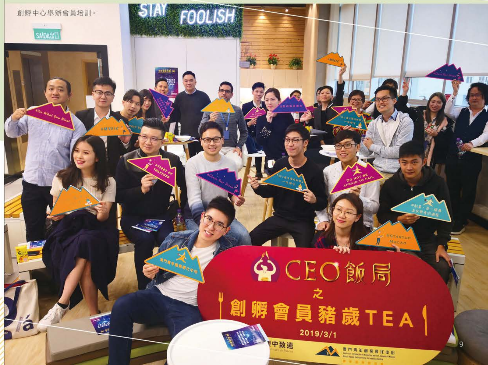
創孵中心舉辦會員培訓。

目前，進駐創孵中心的會員項目已有100多個，其中一半以上是科技企業。創孵中心為他們提供孵化器、加速器、共享空間，提供免費的法律、稅務諮詢、行銷指導，幫助創業者扎實根基。