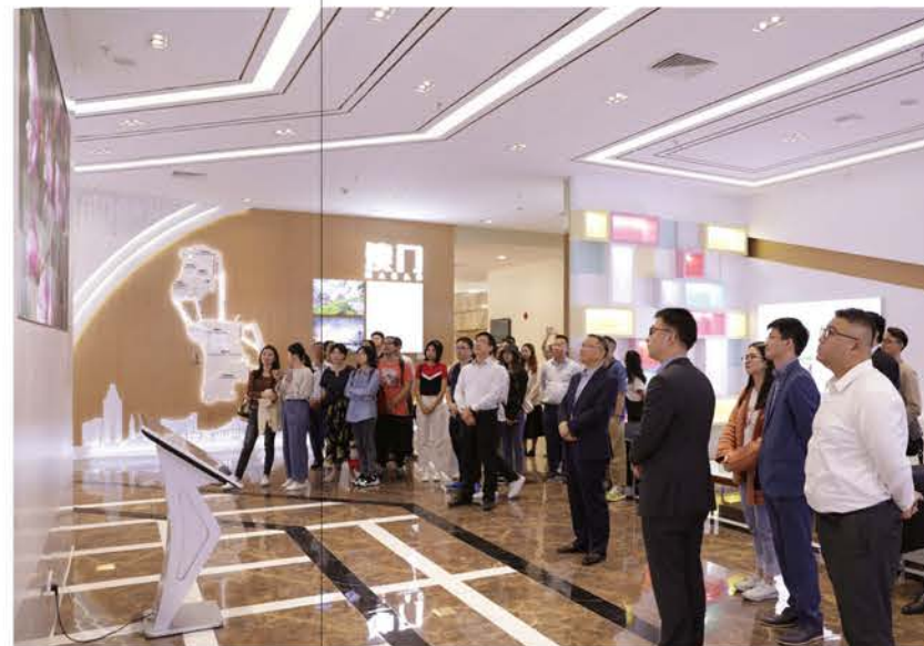
澳中致遠及創孵中心員工參觀考察園區。

涵蓋“葡語系國家特色產品展示中心”、“澳門中山科研成果轉化中心”等功能佈局，旨在充分發揮澳門“中國與葡語國家商貿合作服務平台”的作用、拓展中山與葡語系國家交流合作，以及推進中山澳門兩地雙創產業孵化合作。透過園區，賦能澳門青創進一步連結內地與海外雙創資源，加速融入區域合作、建設一帶一路歐洲門戶的國家發展大局。