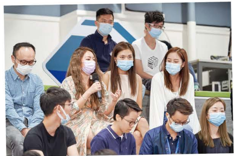
育成計劃為創孵會員提供溝通交流平台。