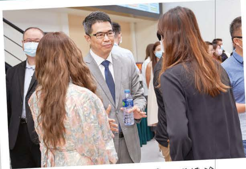
帶教模式助青創收獲大企業合作經驗。