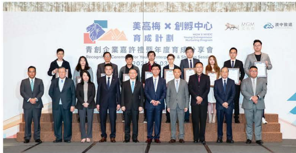
十名積極參與計劃、提出可行創新方案並獲採購意向的青創會員獲頒發嘉許狀。