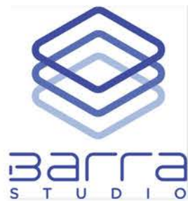
美高梅 × 創孵中心 育成計劃

起躍創科設計有限公司於 2018 年進駐創孵中心，從事 AR 擴增實境內容創作。為美高梅的全方位極限表演 Fuerza Bruta，設計同創作了創新 AR 互動裝置，為入場觀眾提供獨特體驗。