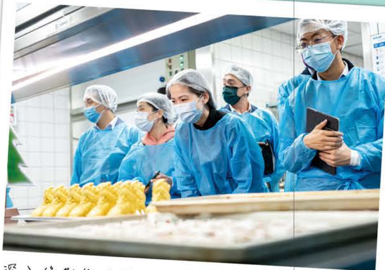
深入後勤能了解企業標準及實務需求。